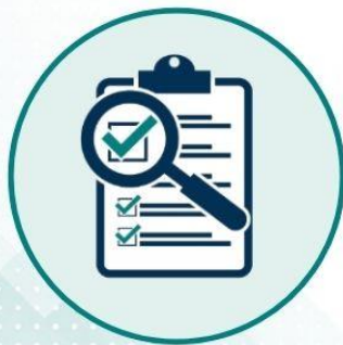
Ön Değerlendir me